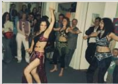
Kultúrny program – DOŠ Internát Bratislava