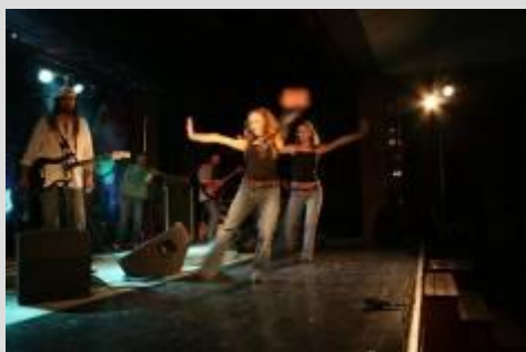
Za spolupráce s Colours o.z a IGYK o.z sme organizovali kultúrny festival v Šali