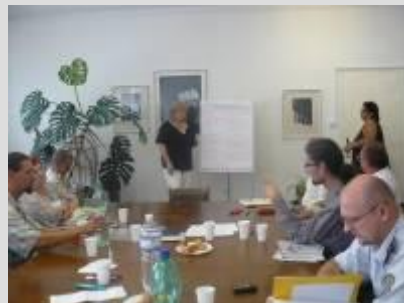
Séria verejných stretnutí v Nových Zámkoch