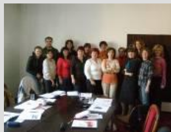
Literárny krúžok Mestská knižnica N. Zámky