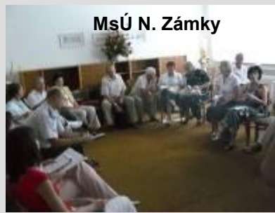
MsÚ N. Zámky