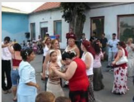
Rómska zábava vo Dvoroch nad Žitavou