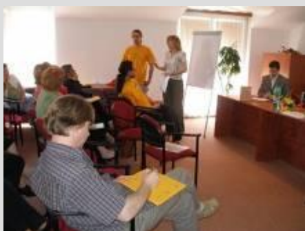
Konferencia – workshop

po skončení konferencie sme navštívili Ostrihomskú baziliku a termálne kúpalisko