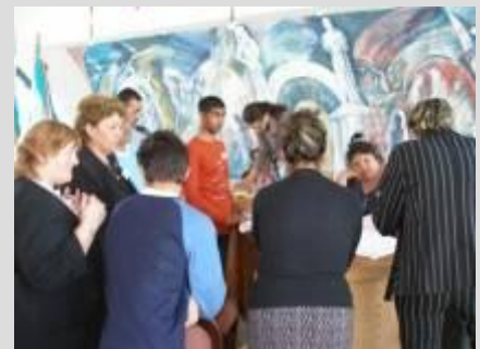
Séria verejných stretnutí v obci Dvory nad Žitavou