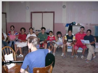
kultúrno – spoločenský večierok v obci Bátorové Kosihy