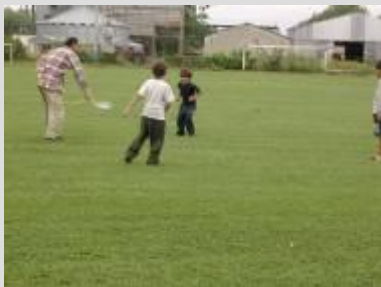
Športové dni pre deti