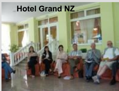
Hotel Grand NZ