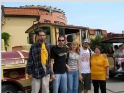
Organizátori – príchod