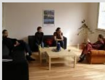
Diskusné stretnutie predstaviteľov literárnych klubov v Nitre