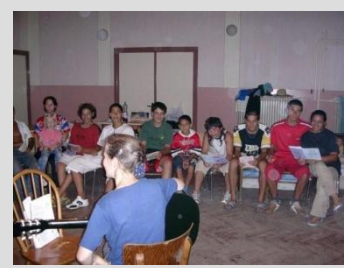
Literárny večierok DK Dvory nad Žitavou