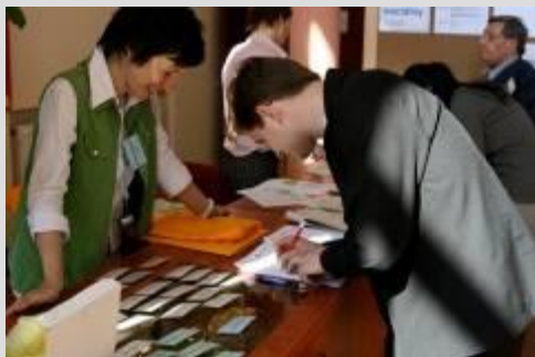
registrácia účastníkov – reportér STV