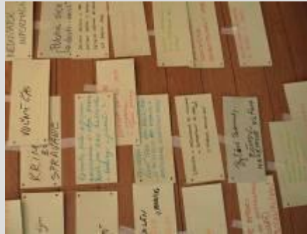
Verejné stretnutia uskutočnené na obecnom úrade v obci Dubník