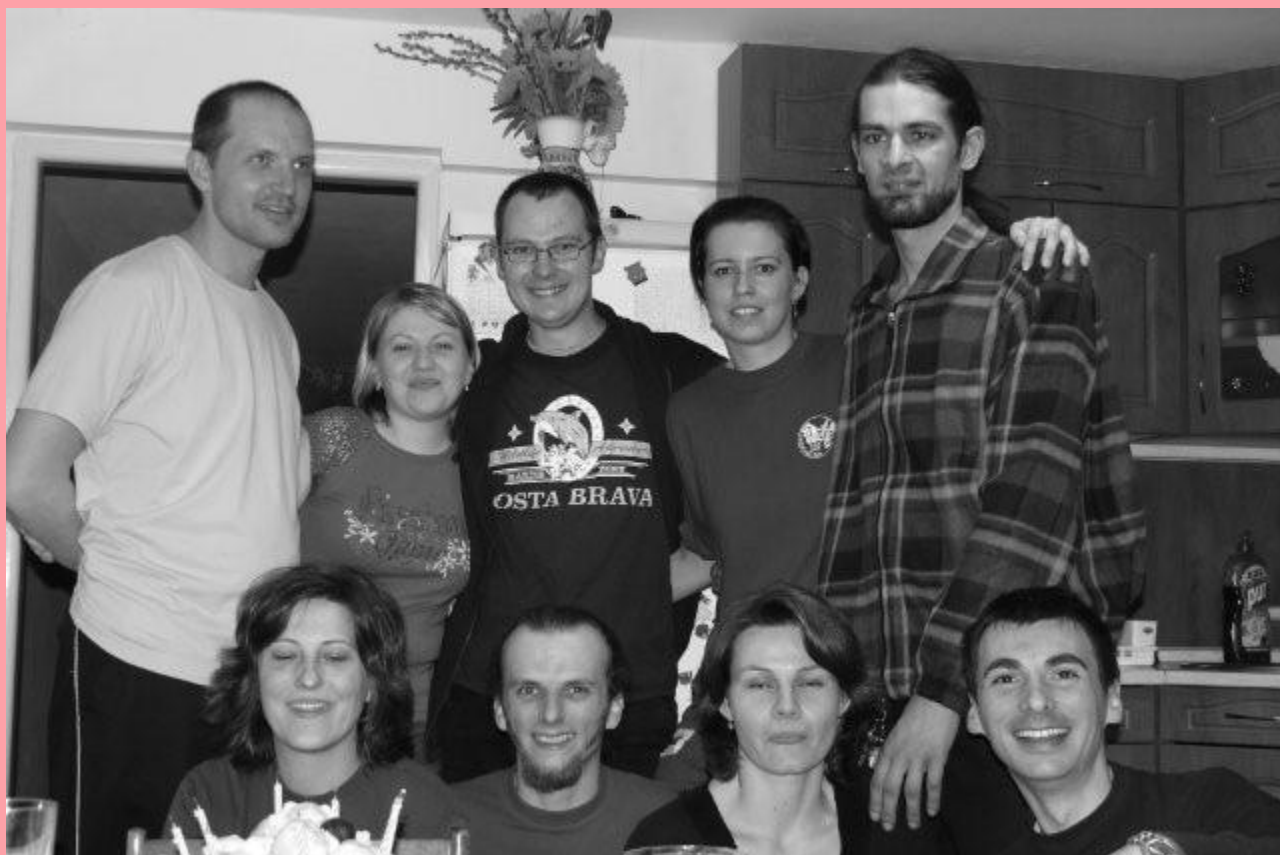
Predseda a členovia správnej rady MEA2000 o. z.

Ak sa nám podarí získať potrebné finančné prostriedky na zakúpenie notebookov, ešte tento rok plánujeme začať s realizáciou 6 týždňových vzdelávacích aktivít vo viacerých regiónoch.