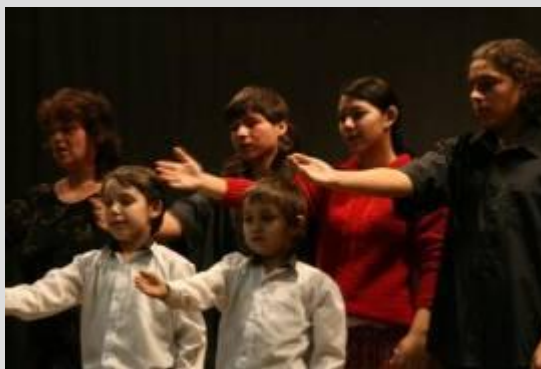
Vianočný kultúrny program v DK Šurany