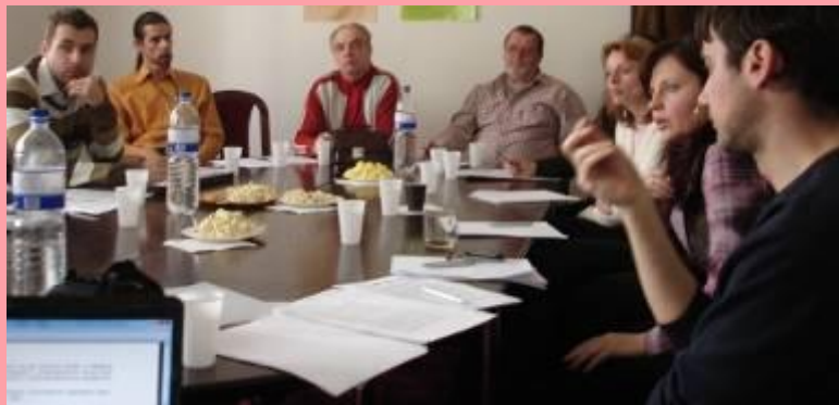
Zasadnutie správnej rady

UPSVaR Nové Zámky UPSVaR Šurany UPSVaR Komárno Úrad Nitrianskeho samosprávneho kraja Slovenská Národná knižnica a ďalšie knižnice po celej SR