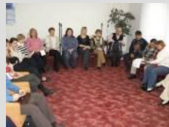
Večierok umeleckého prednesu v Bratislave