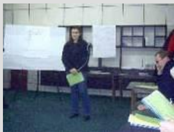
Stretnutie ml. spisovateľov DK v Komárne