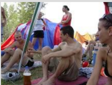
Letný tábor – stanovačka pri Váhu v Komárne