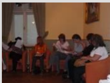
Stretnutie literárnych klubov v Žiline