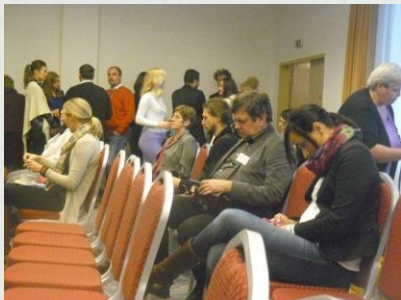
Konferencia s medzinárodnou účasťou Hotel CHOPIN BA 3-4 decembra 2014

Okrem zaujímavých informácií o pripravovaných aktivitách, grantových programoch zúčastnení mohli klásť otázky a pripomienky k zlepšeniu navrhovaných opatrení, priamo sa zúčastňovať na tvorbe nových legislatívnych návrhov a opatrení jednotlivých štátnych rezortov, poukázať na aktuálne problémy a nedostatky v doterajších či navrhovaných opatreniach a prispieť svojimi reálnymi potrebami do tvorby pilotných projektov a predovšetkým výmeny skúseností medzi zúčastnenými vedúcimi neziskových organizácií a budovania aktívneho dialógu a spolupráce.